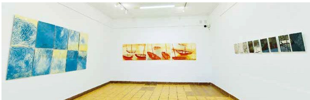
Ryc. 86. Arboretum Galeria u Piotra. Wystawa Nature de la Nature Stowarzyszenia Nomades z Francji, 2007