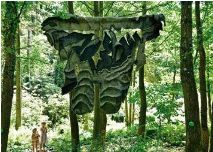
Ryc. 90. Narcyz Piórecki. Trofeum, 2018