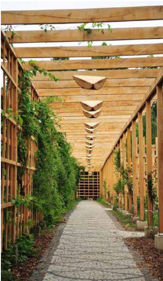
Ryc. 78. Alain Lapicoré. Eskadra dronów, 2015, fot. N. Piórecki