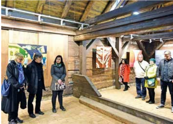
Ryc. 92. Wernisaż wystawy Impresje Mikołowskie. Sztuka Współczesna: Malarstwo / Grafika / Formy Przestrzenne, 2019