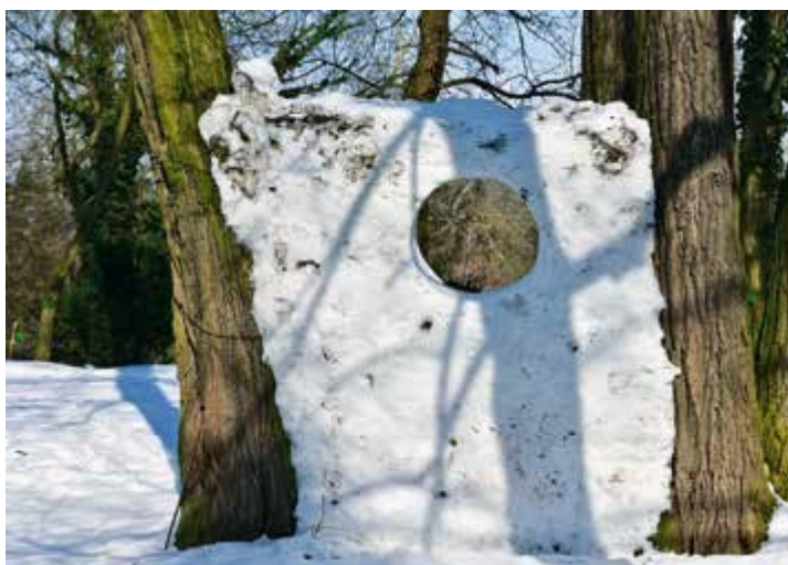
Ryc. 87. Wojciech Hora. WALLFROST praca prezentowana na wystawie Interpretacje przestrzeni 2018 towarzyszącej XIII Międzynarodowemu Seminarium Naukowemu Natura Kultura, 2018