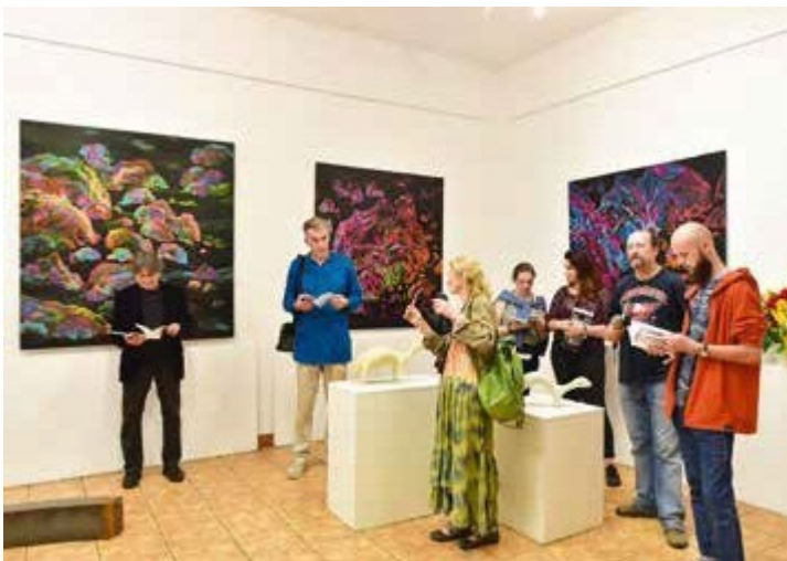
Ryc. 91. Wernisaż wystawy artystów słowackich Zemplínska Karička, zorganizowanej przez Miejski Ośrodek Kultury i Oświaty w Sninie, 2019