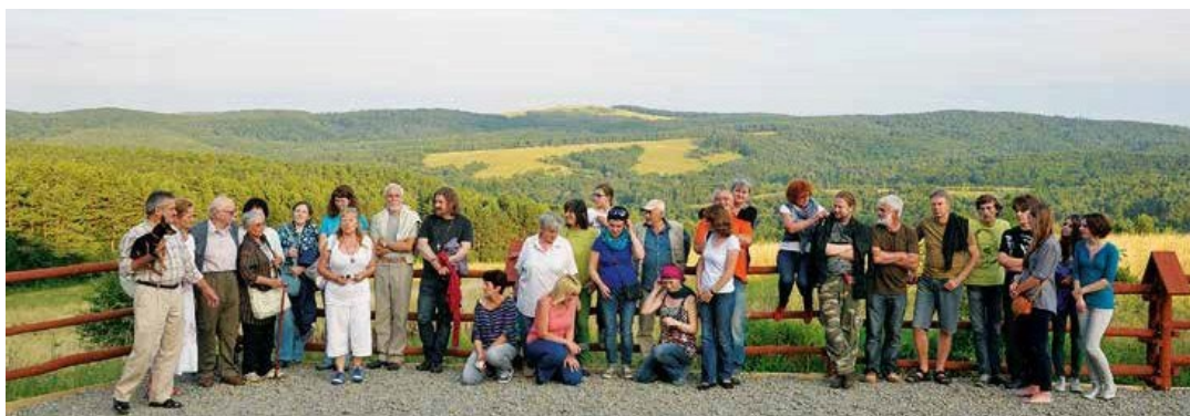
Ryc. 74. Uczestnicy projektu Blisko natury. Warsztaty twórcze dla seniorów oraz XII Międzynarodowego Pleneru Artystycznego Wiklina w Arboretum 2014, na punkcie widokowym w Cisowej, 2014, fot. N. Piórecki