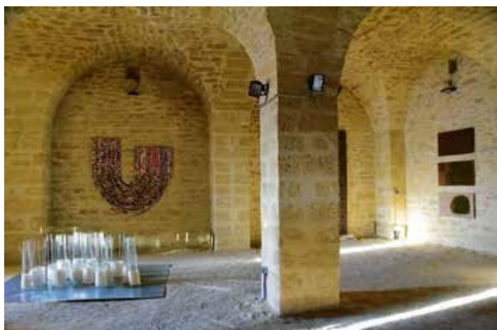
Ryc. 84. Wystawa Natura Natury w zamku Aubais we Francji, 2017