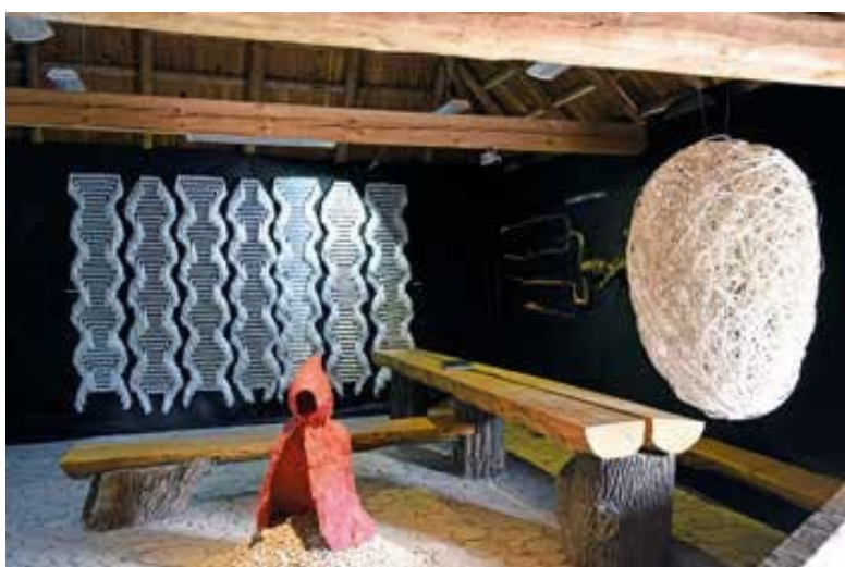
Ryc. 79. Wystawa zbiorowa Sztuka włókna w kręgu Arboretum w Bolestraszcach, 2016