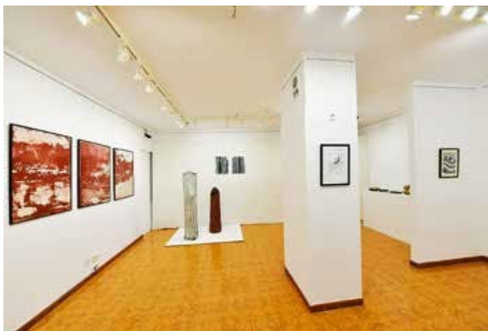
Ryc. 85. Wystawa Interpretacje przestrzeni 2017 towarzysząca XII Międzynarodowemu Seminarium Naukowemu Natura Kultura, 2017