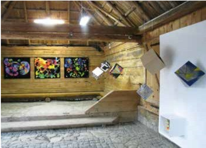
Ryc. 77. Wystawa prac pedagogów z Katedry Architektury Wnętrz Akademii Sztuk Pięknych w Łodzi, 2015, fot. N. Piórecki