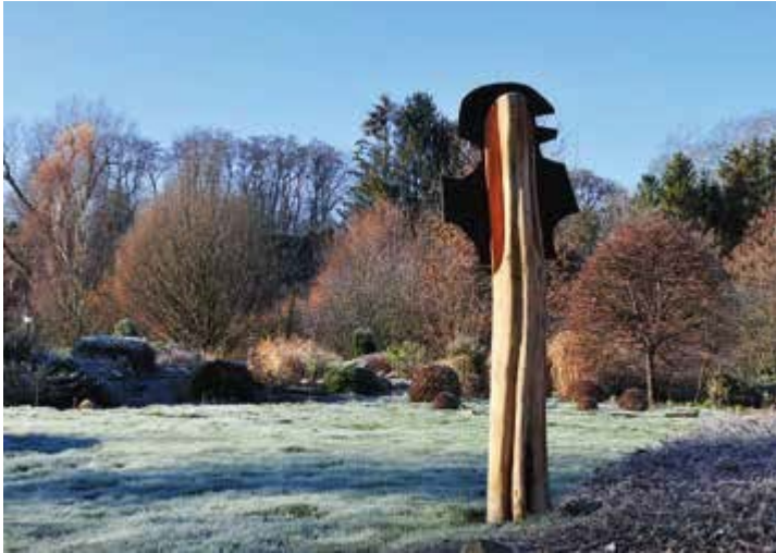
Ryc. 89. Piotr Szwiec. Strażnik – centurion wyznacznik miejsca, 2018