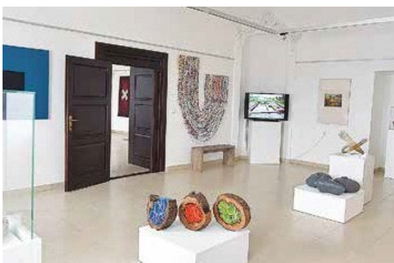
Ryc. 80. Sztuka polska Artyści w kręgu Arboretum w Bolestraszcach. Wystawa na zamku w Sninie na Słowacji, 2016