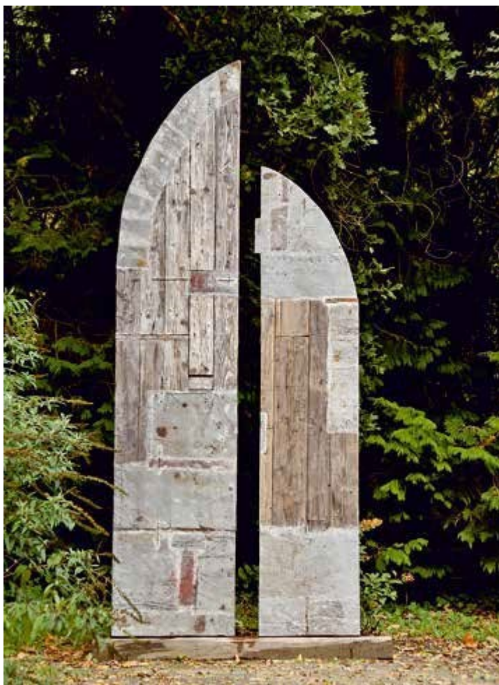
Ryc. 81. Waldemar Rydyk. Histoire quotidienne, 2016